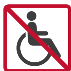
arrêt non accessible